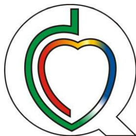
Slika 1 Varuje zdravje

Društvo za zdravje srca in ožilja je oblikovalo znak »Varuje zdravje«, ki nam pomaga pri nakupovanju in izbiri primernejših, bolj zdravih živil.