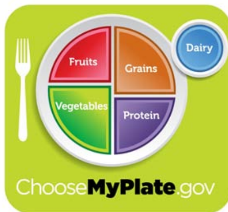
Slika 4 Moj krožnik